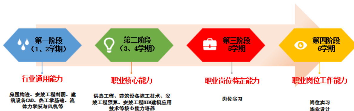
图1 “分层培养、四阶递进”人才培养模式示意图

第四阶段，职业岗位综合能力培养阶段，通过带薪顶岗实习，使学生进一步熟悉岗位职能要求和专业知识、专业技能要求，专业综合素质得到进一步提升，能够胜任本职业岗位工作，完成准职业人的培养。