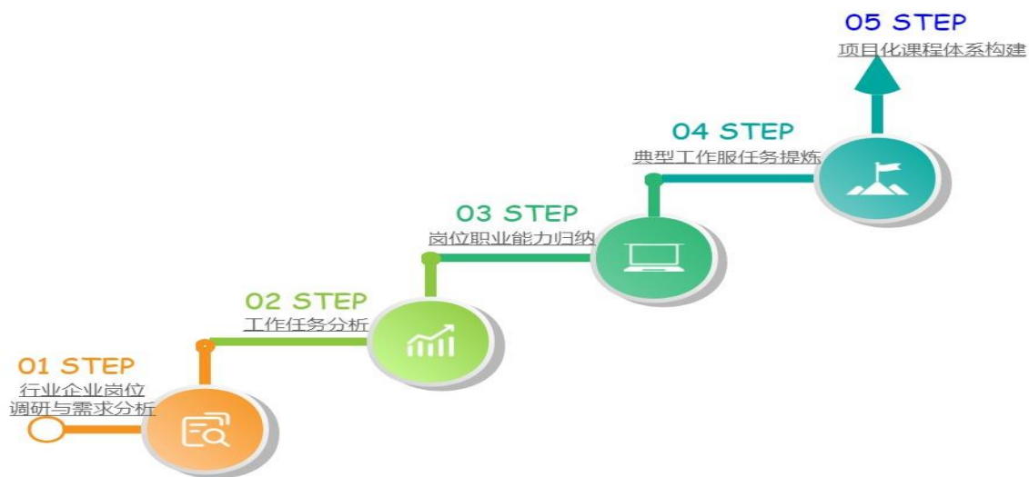
课程体系开发流程图